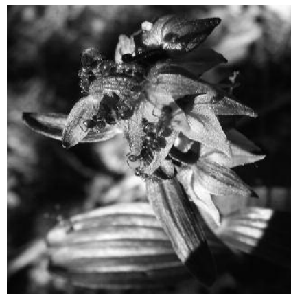
Biodiversité : fourmis sur orchidée

Malgré cela, la biodiversité continue de s'appauvrir : en Belgique, 1/3 des espèces vivantes sont menacées de disparition.