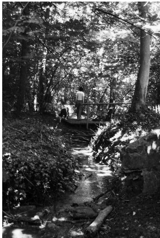
Exemple de biodiversité : zone humide au Kinsendaal

BN demande la mise en œuvre effective et urgente de la Convention européenne du paysage dans la Région de Bruxelles-Capitale au travers d'une coordination de cette convention entre les ministres de l'environnement et de la préservation de la nature, des Monuments & Sites (patrimoine vert et bâti), de l'aménagement du territoire, de l'agriculture.