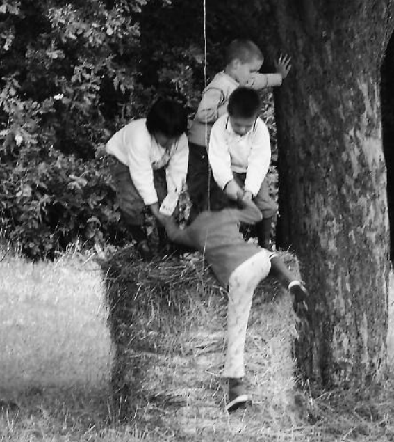
Les enfants, c'est l'avenir, l'espoir du monde solidaire ...