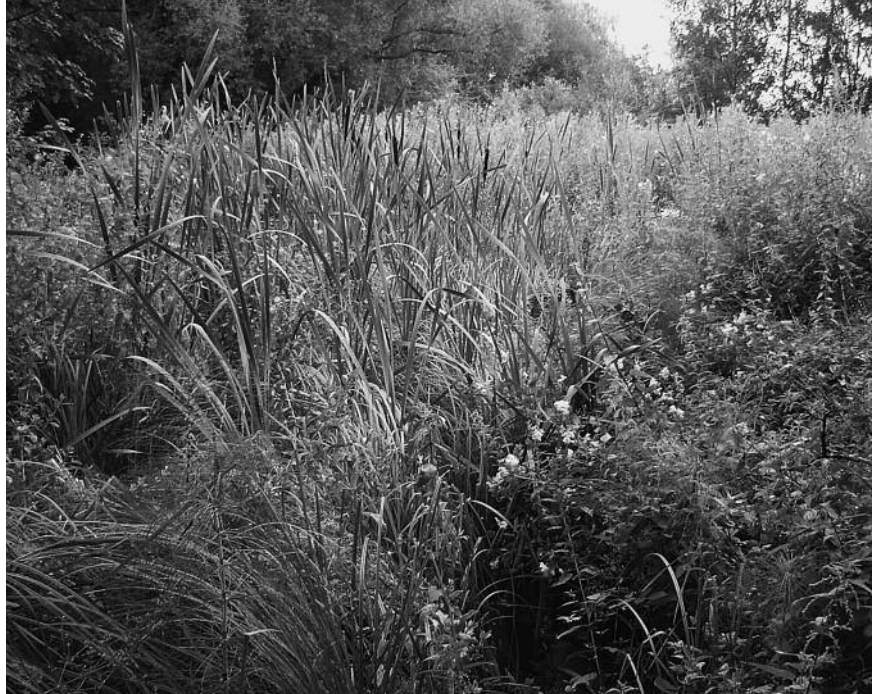
Exemple de biodiversité : massettes au Kawwberg

tion plus sévère de la vente aux particuliers et des mesures de contrôle de la publicité, et insiste, d'autre part, sur la nécessité de sensibiliser la population aux dangers liés à l'usage de ces produits par le biais de campagnes d'information visant tant les gestionnaires publics que les citoyens. En matière agricole, BN recommande une transition vers des cultures biologiques.